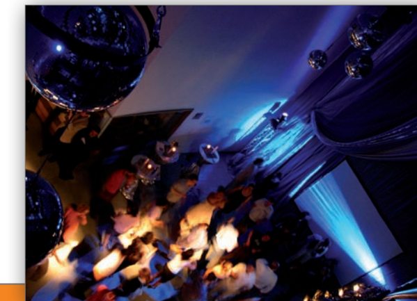
Solarnacht Fraunhofer ISE

Wir laden Presse, Experten sowie Prominente ein und betreuen diese. Am Tag der Veranstaltung stellen wir vor Ort sicher, dass alles läuft wie geplant.